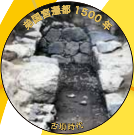
弟国宮遷都 1500年 古墳時代