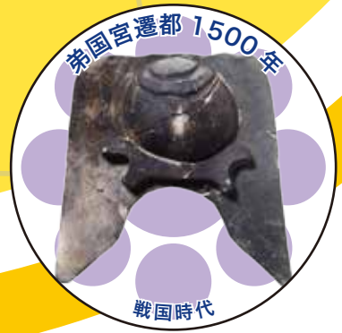
弟国宮遷都 1500年 戦国時代

2018年缶バッジプレゼント企画では、継体大王の弟国宮遷都から1500年を記念したロゴバッジをご用意しました。また、3～6月は古墳、7～9月は長岡京、10～12月は勝龍寺城の特別な図柄も用意しています。プレゼント期間中は、毎回4つの図柄から1点を選んで頂けます。(来館者お一人様につき1点プレゼント)