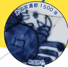
弟国宮遷都 1500年 戦国時代