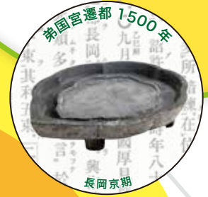
弟国宮遷都 1500年 長岡京期