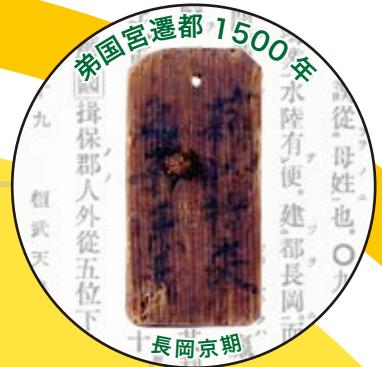
弟国宮遷都 1500年 長岡京期