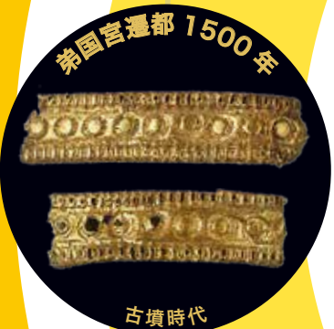
弟国宮遷都 1500年 古墳時代