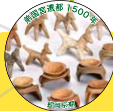
弟国宮遷都 1500年 長岡京期